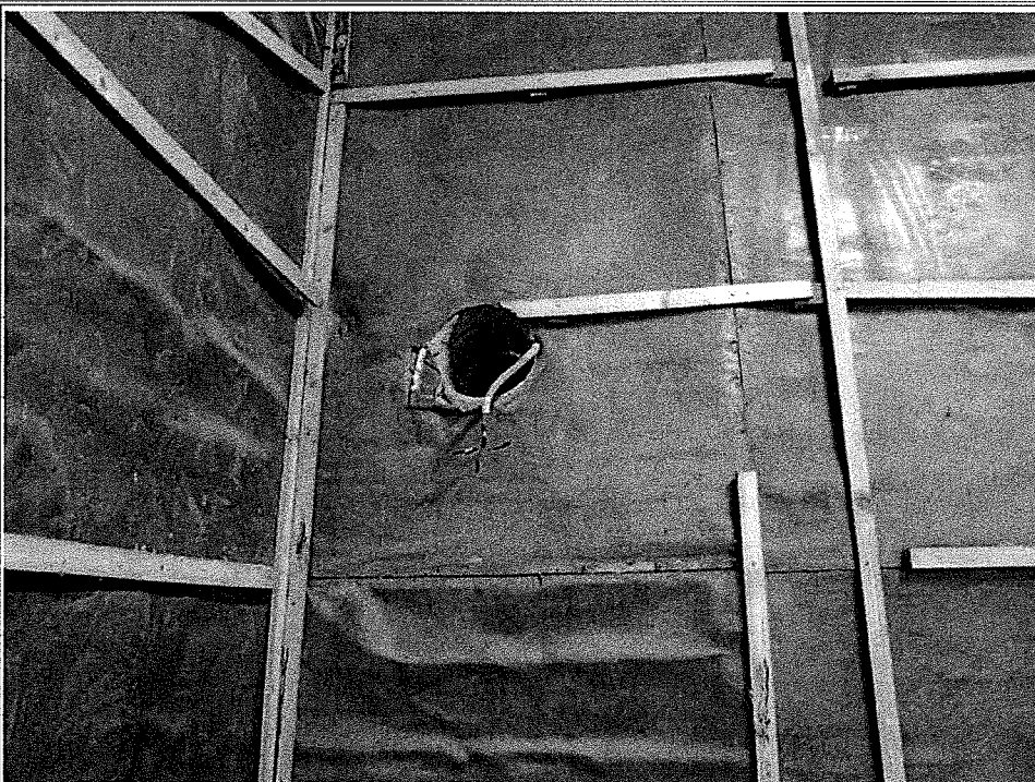
Rimozione rivestimento pareti sala RX