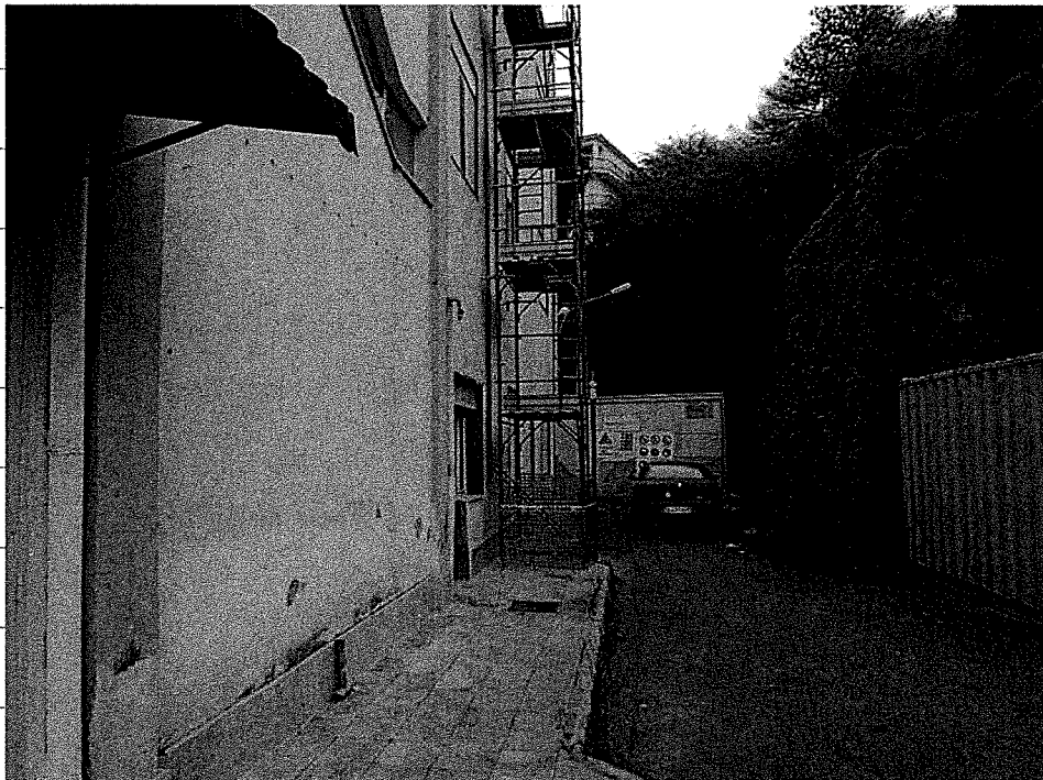
Baracca di cantiere e ponteggio esterno