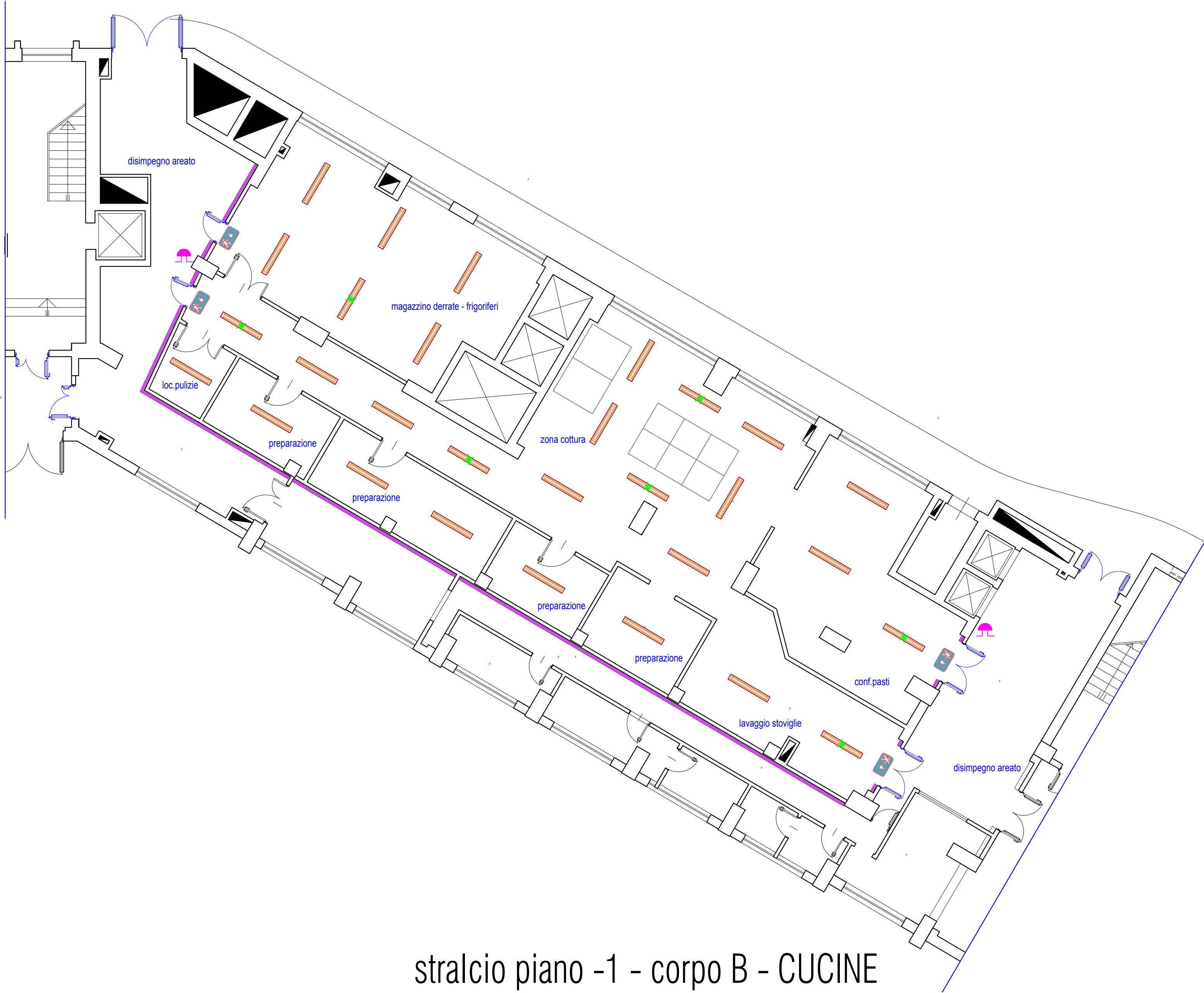
stralcio piano -1 - corpo B - CUCINE